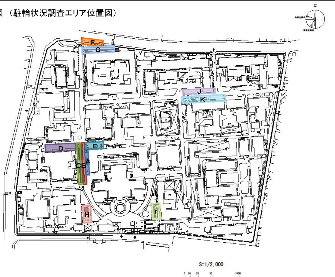
本部構内 配置図 (駐輪状況調査エリア位置図)